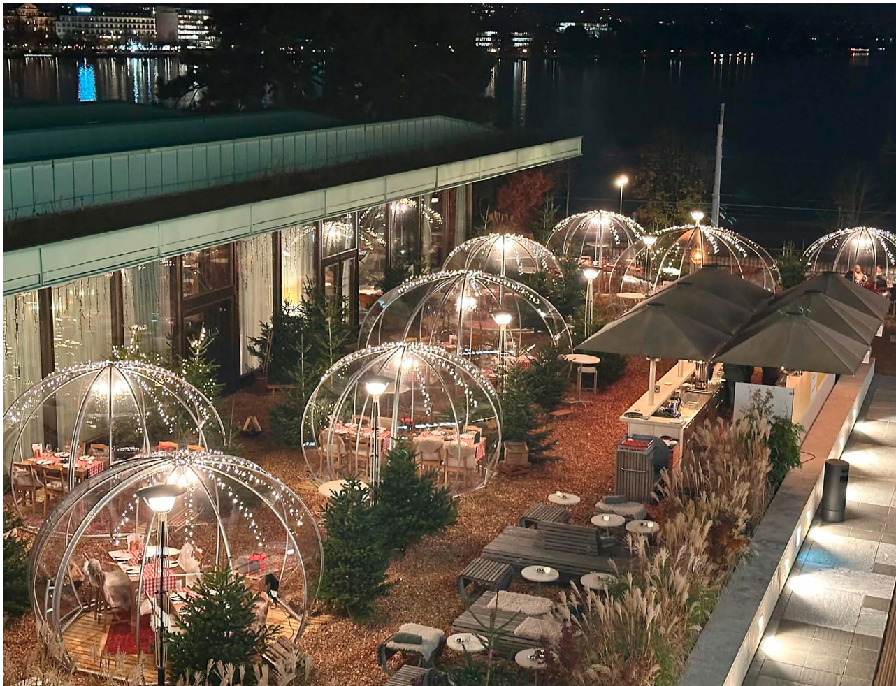
Letzten Winter verwandelte sich die Terrasse des LUX Restaurant & Bar in den Iglu-Zauberwald – mit Blick auf den Zürichsee.